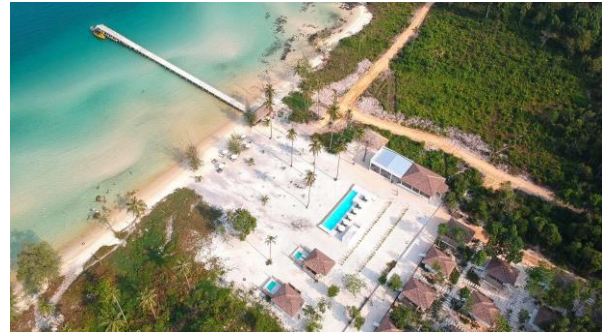
Anaya Resort auf Koh Rong

Transfer nach Sihanoukville und Fahrt mit dem Hoteleigenen Speedboat auf die Insel Koh Rong . Check-in im Hotel Anaya oder Tamu Resort, die am gleichen Strand direkt nebeneinander liegen. (B)