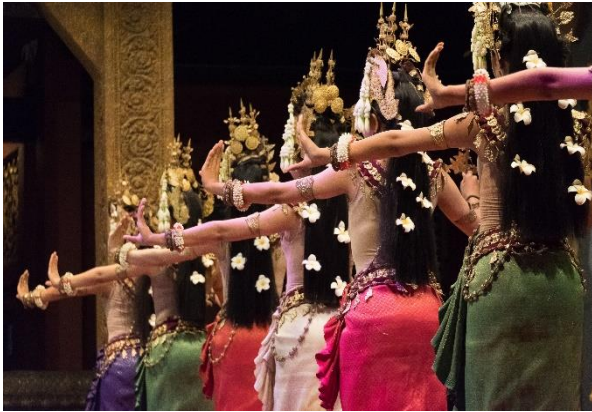
Tanzvorführung der Apsara Tänzerinnen in Siem Reap

Am Vormittag Fahrt zum Dschungeltempel Sambor Prei Kuk , der 600 n.Chr. die Hauptstadt von Kambodscha gebildet hat, heutzutage aber in Vergessenheit geraten ist und kaum noch besucht wird. Mittagessen als Picknick in der mystischen Tempelanlage. Am Nachmittag Ankunft in einer typischen und nicht touristischen Provinzstadt: Kampong Thom . Check-in im Glorious Hotel & Spa . Gemeinsames Abendessen im Hotel oder in einem traditionellen Restaurant in der Stadt. (B/L/D)