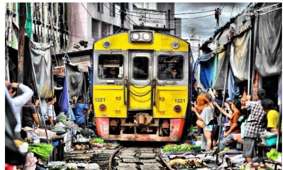
«Train-Market» in Maeklong

Morgens Abfahrt zu den weltberühmten Schwimmenden Märkten in Damnoen Saduak . Weiterfahrt nach Bangkok mit Halt bei einem typischen, einheimischen Markt in Maeklong , der auch dafür bekannt ist, dass mehrmals täglich ein Zug mitten durch die Marktstände fährt. Mittagessen unterwegs. Nachmittags Check-in im Hotel Cross Vibe Bangkok Sukhumvit . Dieses liegt in einem der beliebtesten Quartiere der Metropole Bangkok und verführt zum Einkaufen oder um eine unvergessene «One Night in Bangkok» zu erleben. (B/L)