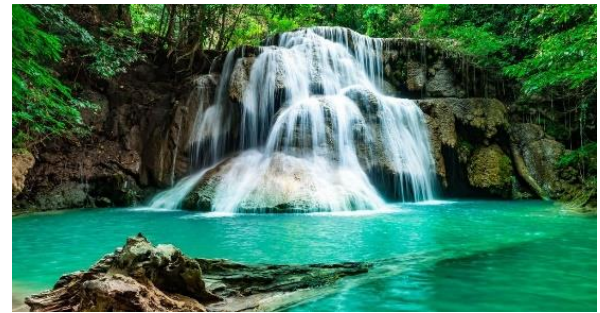
Kleiner Teil vom Erawan Wasserfall in Kanchanaburi

Am Vormittag Besuch der Lawa -Höhlen und dem wunderschönen, mehrstufigen Erawan -Wasserfall mit der Möglichkeit, in einem der «Naturpools» mitten im Dschungel zu schwimmen. Mittagessen in einem lokalen Restaurant unterwegs. Am Nachmittag Check-in im Royal River Kwai Resort & Spa . Zeit zur eigenen Verfügung und wiederum die Möglichkeit, sich im hoteleigenen Spa eine Massage oder Behandlung zu gönnen. (B/L)