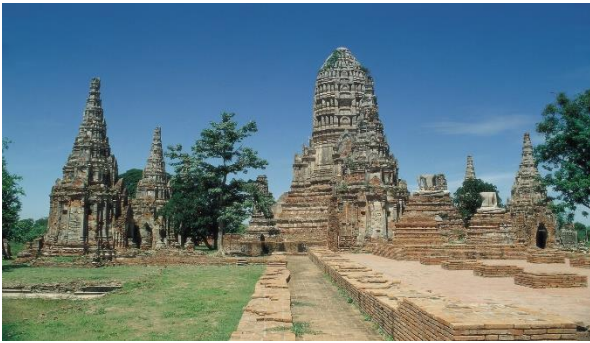
Die ehrwürdigen Ruinen von Ayutthaya

Mi 19.11.: Ayutthaya. Am Vormittag Besuch der weltberühmten und eindrucklichen Tempelanlagen. Mittagessen in einem lokalen Restaurant. Am Nachmittag Zeit zur freien Verfügung. Abends offizielles Willkommensessen auf einer typischen, thailändischen Reisbarke auf dem Fluss. (B/L/D)