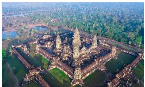
Die weltberühmte Tempelanlage von Angkor Wat

Besuch der weltberühmten Tempelanlagen von Angkor Wat . Mittagessen unterwegs. Am Abend Besuch einer traditionellen Tanzshow mit grossem Buffet und anschliessend Zeit zur freien Verfügung. Übernachtung im Hotel Central Suite Residence (B/L/D)