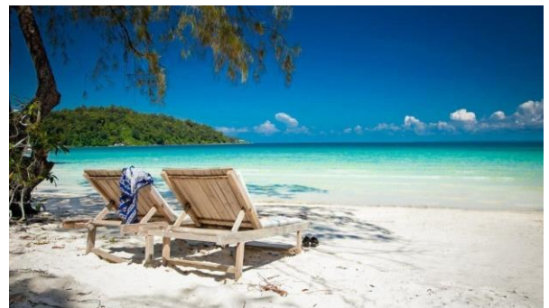
Sandstrand von Koh Rong

Tag zur eigenen Verfügung. Boots- und Tauch-/ Schnorchelausflüge sind im Hotel buchbar, genauso wie sportliche Aktivitäten wie z.B. Kayak. (B)