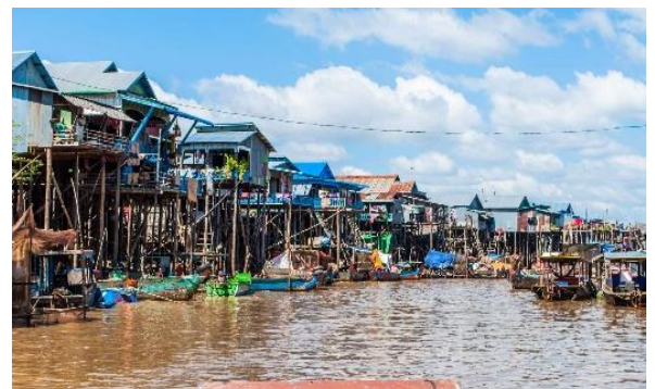
Das beeindruckende Stelzendorf Kampong Phluk

Fahrt nach Siem Reap . Mittagessen in Snackform unterwegs und Check-in im Hotel Central Suite Residence . Nach einer kleinen Rast im Hotel Fahrt zum faszinierenden Stelzendorf Kampong Phluk und dem grössten See des Landes, dem Tonlé Sap mit Abendessen bei Sonnenuntergang auf einem Restaurant mitten auf dem See. Zurück in Siem Reap besteht die Möglichkeit, den Nachtmarkt des lebendigen Ortes zu besuchen. Übernachtung im Hotel Central Suite Residence . (B/L/D)