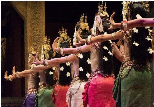
Tanzvorführung der Apsara Tänzerinnen in Siem Reap

Am Vormittag Fahrt zum Dschungeltempel Sambor Prei Kuk , der 600 n.Chr. die Hauptstadt von Kambodscha gebildet hat, heutzutage aber in Vergessenheit geraten ist und kaum noch besucht wird. Mittagessen als Picknick in der mystischen Tempelanlage. Am Nachmittag Ankunft in einer typischen und nicht touristischen Provinzstadt: Kampong Thom . Check-in im Glorious Hotel & Spa . Gemeinsames Abendessen im Hotel oder in einem traditionellen Restaurant in der Stadt. (B/L/D)