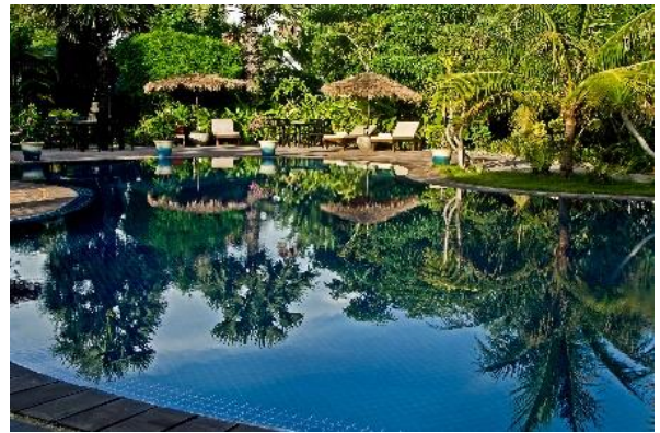
Die tropische Hotelanlage Battambang Resort

Am Morgen Besuch des Marktes in Battambang, einem der typischen und lebendigen Märkte Kambodschas. Anschliessend Fahrt zum Dorf Rajomhin wo die Verwandten von Red zuhause sind und sich sonst wohl nie ein Tourist hin verirrt. Besuch der Schule und Erleben des typischen Dorflebens der Einheimischen. Mittagessen bei der Familie von Red. Abends Besuch im Zirkus, dem « Cirque du Soleil » Kambodschas. Hier können junge, einheimische Talente, die keine finanziellen Möglichkeiten haben eine Zirkusschule zu besuchen, eine kostenfreie Ausbildung machen und danach ihr Können bei den Shows demonstrieren. Gemeinsames Abendessen in der Stadt und Übernachtung im Battambang Resort . (B/L/D)