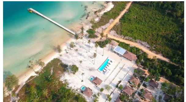
Anaya Resort auf Koh Rong

Transfer nach Sihanoukville und Fahrt mit dem Hoteleigenen Speedboat auf die Insel Koh Rong . Check-in im Hotel Anaya oder Tamu Resort, die am gleichen Strand direkt nebeneinander liegen. (B)