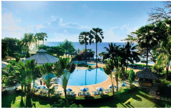
Direkt am Sandstrand: Hotel Novotel Rim Pae

Fahrt von Bangkok nach Rayong . Unterwegs Besuch des Tempels Wat Pa Pradu mit dem riesigen, liegenden Buddha. Mittagessen in einem lokalen Restaurant unterwegs und kurz danach Check-in im Novotel Rim Pae Rayong Resort , welches direkt am schönen Sandstrand liegt. Rest des Tages zur freien Verfügung, um das Meer zu geniessen und um die bisher gewonnen Eindrücke der Reise auf dem Liegestuhl zu verarbeiten. (B/L)