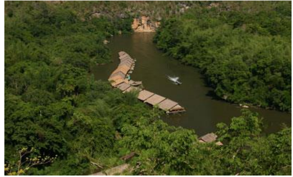
Unterkunft River Kwai Jungle Raft