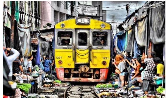
«Train-Market» in Maeklong

Morgens Abfahrt zu den weltberühmten Schwimmenden Märkten in Damnoen Saduak . Weiterfahrt nach Bangkok mit Halt bei einem typischen, einheimischen Markt in Maeklong , der auch dafür bekannt ist, dass mehrmals täglich ein Zug mitten durch die Marktstände fährt. Mittagessen unterwegs. Nachmittags Check-in im Hotel Cross Vibe Bangkok Sukhumvit . Dieses liegt in einem der beliebtesten Quartiere der Metropole Bangkok und verführt zum Einkaufen oder um eine unvergessene «One Night in Bangkok» zu erleben. (B/L)