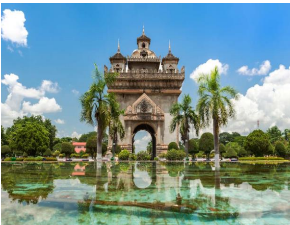
Das Patuxai Monument in Vientiane

Am Morgen Transfer zum Bahnhof und Fahrt mit dem modernen Schnellzug in die Hauptstadt von Laos, Vientiane . Check-in im Boutique Hotel Salana , welches im Herzen der Stadt liegt. Am späteren Nachmittag Stadtrundfahrt zu den wichtigsten Sehenswürdigkeiten der kleinsten Hauptstadt von Asien, wie dem Wahrzeichen von Laos, der goldenen Stupa oder dem Patuxai Monument , das dem Arc de Triomphe in Paris nachempfunden wurde. Anschliessend Zeit, die Stadt selbstständig in ihren Abendstunden zu entdecken oder auf dem weitläufigen Nachtmarkt zu stöbern. (B)