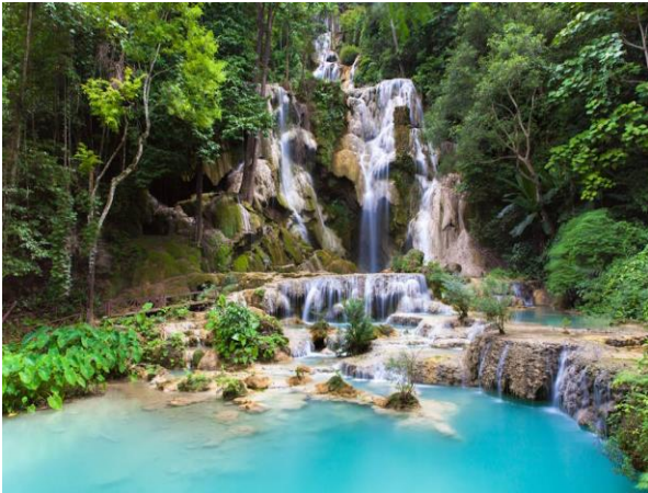
Traumhaft schön: der Kuang Si Waterfall nahe Luang Prabang

Vormittags Besuch des lokalen Marktes, wo teilweise für Europäer gänzlich unbekannte Früchte und Gemüse angeboten werden. Weiter City-Tour mit Besuch im Königsmuseum und dem ältesten und wichtigsten Tempel des Ortes, dem Wat Xiengthong . Anschliessend Fahrt mit Privatboot entlang von Luang Prabang mit Stopps bei einer ursprünglichen Töpferei, oder bei dem, hoch über dem Fluss erbautem Tempel, Wat Chom Pet . Am Nachmittag Zeit zur eigenen Verfügung, um z.B. mit einem Fahrrad durch die ehemalige Königsstadt zu radeln, oder (ein Muss bei einem Besuch in Luang Prabang !), über 328 Stufen den Phusii Hügel zu erklimmen und die Aussicht auf die Stadt zu geniessen. (B)