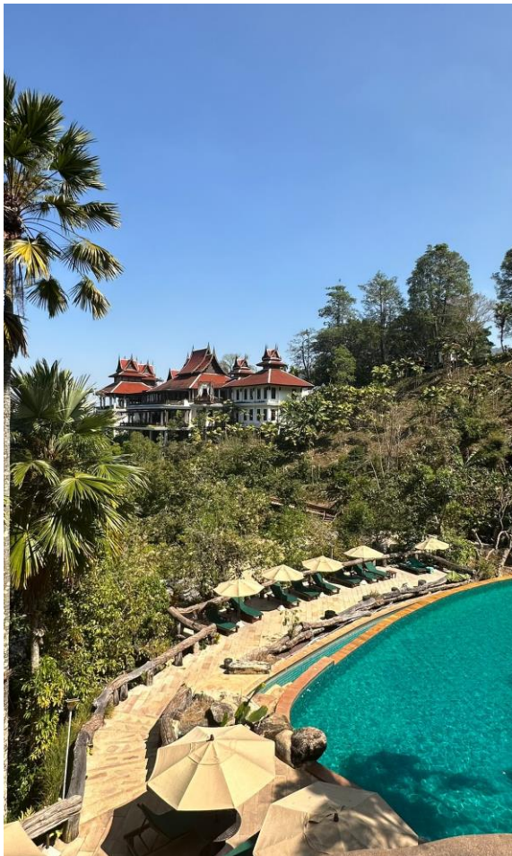
Mitten in den Bergen von Chiang Mai: das Panviman Resort & Spa