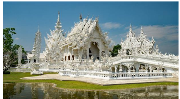
Der weltweit einmalige «Weisse Tempel» in Chiang Rai

Fahrt nach Chiang Rai , der zweiten grossen Metropole im Norden Thailands. Besuch des Weissen Tempels , der in seiner Art weltweit einmalig ist. Nach dem Check-in im Hotel Wiang-Inn Zeit zur freien Verfügung, um die gemütliche Stadt zu erkunden oder den Nachtmarkt zu besuchen. (B/L)