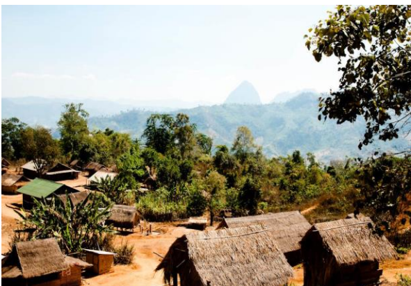
Eines der typischen Bergdörfer im Norden von Laos

Fahrt durch die hügeligen Landschaften, mit wiederum grandiosen Aussichten und einem weiteren Stopp bei einem Hmong-Bergstamm . Ankunft im Nong Kiau Riverside Resort im Verlauf vom Nachmittag. Gegen Abend die Option, um an einem weiteren, aber kürzeren Trekking (zirka 2.5 Stunden) zu einem der schönsten Aussichtspunkte der Region teilzunehmen. (B)