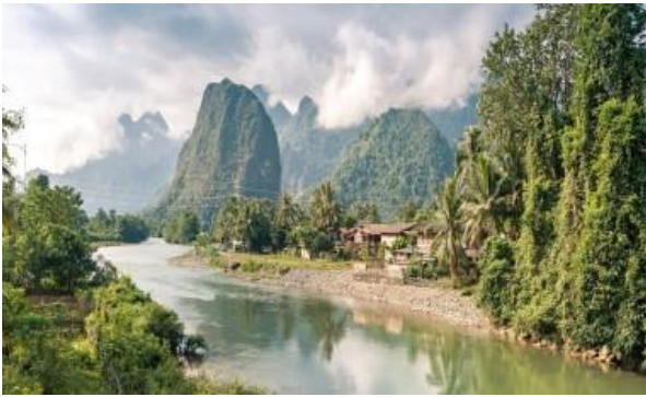
Die imposanten Landschaften um Pakbeng