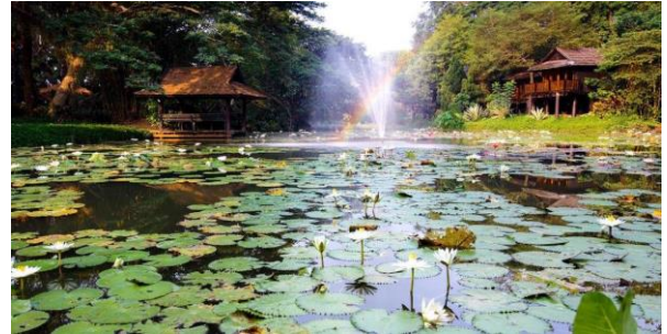
Das idyllische Lampang River Lodge Resort

Fahrt in die Provinzstadt Lampang . Besuch einer Orchidee & Schmetterlingsfarm und dem PooPooPaperPark , wo aus Elefantendung verschiedenste Artikel hergestellt werden. Nach dem Mittag Check-in im am Fluss gelegenen, mitten in der Natur gelegenen Lampang River Lodge Resort . Am Nachmittag die Möglichkeit, eine geführte Fahrradtour zu unternehmen, um die Region kennen zu lernen. Am Abend gemeinsames Essen im Hotel. (B/L/D)