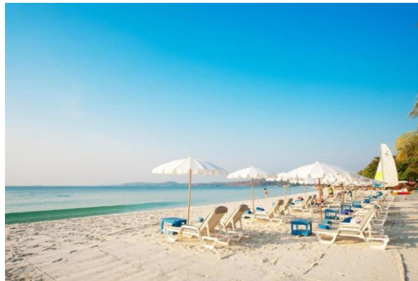
Der weissandige Sai Kaew Beach, auch direkt bei unserem Hotel

Ganzer Tag zur eigenen Verfügung um Boots- oder Tauch-/ Schnorchel Ausflüge zu unternehmen oder weiter im Hotel zu entspannen. (B)