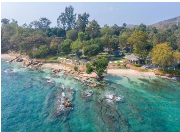
Der ruhige Privatstrand vom Hotel Sai Kaew Beach Resort

Ganze Tag zur eigenen Verfügung um die Insel kennen zu lernen, um am kleinen Privatstrand des Hotels, oder dem weissandigen und langgezogenen Sai Kaew Beach , oder einem der drei Swimmingpools der Hotelanlage zu schwimmen und sich zu entspannen. Abends die Möglichkeit, im wenige Fussminuten entfernten Dorf, oder an einem der Strandrestaurants zu speisen und sich im HYPEN und hoteleigenen Wink's Beach Club einen Drink zu gönnen. (B)