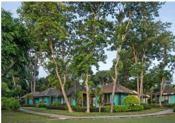
Unsere Unterkunft auf Ko Samed, mitten im tropischen Garten

Transfer nach Rayong und kurze Überfahrt auf die Insel Ko Samed . Check-in am Mittag in einem Bungalow vom Sai Kaew Beach Resort und danach die Möglichkeit, die Hotelanlage und die nahe Umgebung selbstständig zu erkunden. (B)