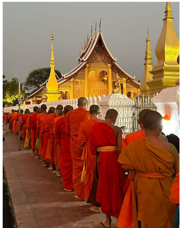
Der morgendliche Almosengang «Tak Bat»

Früh am Morgen Besuch des imposanten Tak Bat , dem morgendlichen Almosengang von mehr als 200 Mönchen & Novizen, der in dieser Art weltweit einmalig ist. Danach Fahrt zu dem naheliegenden, wunderschönen Kuang Si Wasserfall. Unvergessliches Frühstück direkt am Wasserfall und danach genügend Zeit, den Nationalpark zu erkunden und ein erfrischendes Bad mitten im Dschungel zu genießen. Mittags Fahrt zurück zum Hotel und freie Zeit, um Luang Prabang , welches oft als «die schönste Stadt Asiens» bezeichnet wird, zu entdecken. (B)