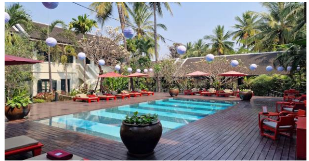
Ehemalige Königsresidenz, jetzt unsere Unterkunft: Villa Maly

Am Morgen die Option, die imposanten Kalksteinhöhlen der Region zu besichtigen. Später Fahrt mit dem Bus durch die atemberaubenden Landschaft entlang des Nam Ou Rivers und per Privatboot auf dem Mekong zu den mysteriösen Pak Ou Höhlen , mit ihren tausenden Buddha-Statuen. Weiterfahrt nach Luang Prabang , während auf dem Boot der Sonnenuntergang genossen werden kann. Check-in im Boutiquehotel Villa Maly , welches nur wenige Gehminuten vom lebendigen Zentrum entfernt liegt. (B/L)