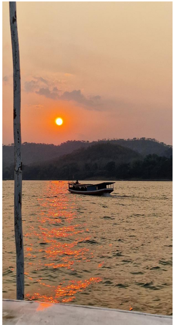
Sonnenuntergangscruise auf dem Mekong