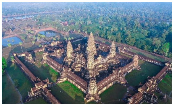
Die weltberühmte Tempelanlage von Angkor Wat

Besuch der weltberühmten Tempelanlagen von Angkor Wat . Mittagessen unterwegs. Am Abend Besuch einer traditionellen Tanzshow mit grossem Buffet und anschliessend Zeit zur freien Verfügung. Übernachtung im Hotel Central Suite Residence (B/L/D)